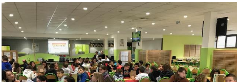
Projet contes CM2 – 6è