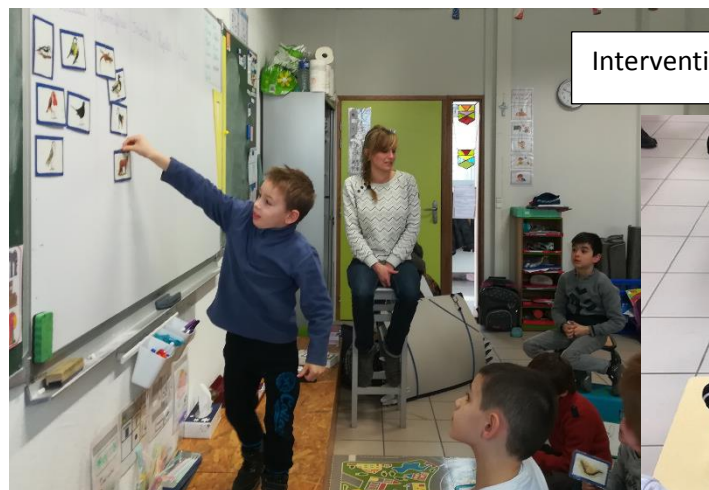
Intervention de la LPO