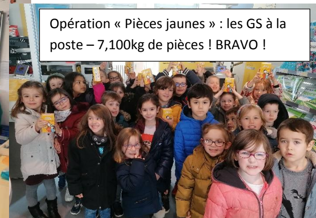
Opération « Pièces jaunes » : les GS à la poste – 7,100kg de pièces ! BRAVO !